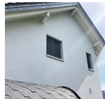
Fassade circa ein Jahr später.