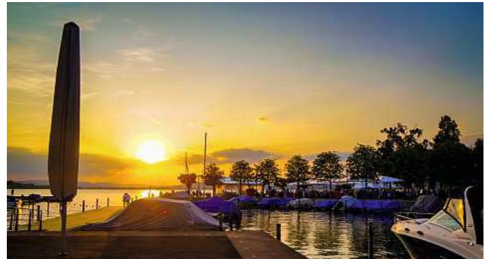
Lachen SZ Seepromenade von Sabrina Grüebler