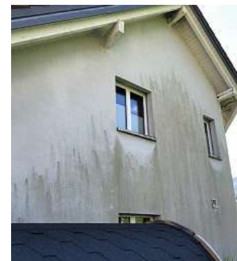
Putzfassade mit Grünalgenbefall.

Die Fachleute sprühen in einer ersten Phase das oberflächenschonende Pro-