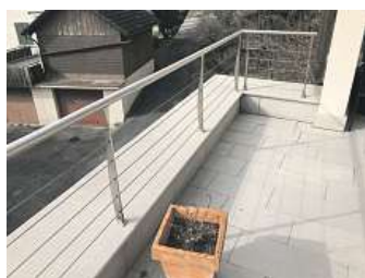
Terrasse circa ein Jahr später.