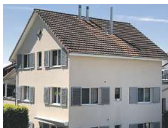
Tonziegel mit Moos und Schwarzalgenbefall