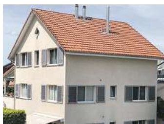
Das Dach circa ein Jahr später.

dukt auf die befallenen Flächen. Das Aufsprühen des Selbstreinigungswirkstoffes dauert nur wenige Stunden. Bereits nach einer Einwirkungszeit von wenigen Tagen beginnen sich in einer zweiten Phase die Mikroorganismen von selbst aufzulösen. Wind und Regen tragen die abgetöteten Partikel mit der Zeit gänzlich ab. Die komplette Selbstauflösung der Organismen dauert je nach Befall rund vier bis zwölf Monate. Sollten nach spätestens 24 Monaten noch Reste des Befalls zu sehen sein, behandelt die Firma kostenlos nach.