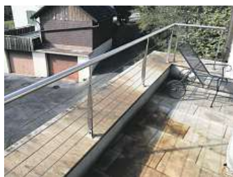
Terrasse mit Flechtenbefall.