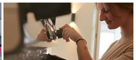
Den Gästen serviert das «Resi»-Team Kaffee aus einer lokalen Rösterei, zubereitet mit einer La Marzocco- Maschine, die unter Kennern als eine der besten gilt.